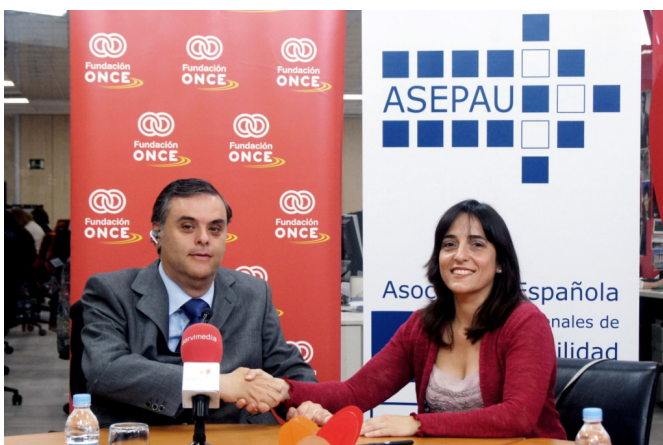
Firma del convenio de colaboración entre Fundación ONCE y ASEP AU