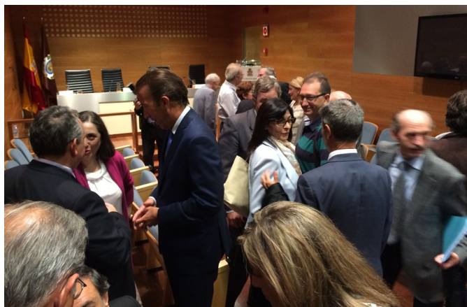
ASEPAU en el ciclo Ingeniería y Accesibilidad

Comenzó el mes de diciembre con la presencia de ASEPAU en el Ciclo de Sesiones sobre "Ingeniería y Accesibilidad" organizadas por la Real Academia de Ingeniería donde participaron varios de nuestros socios.