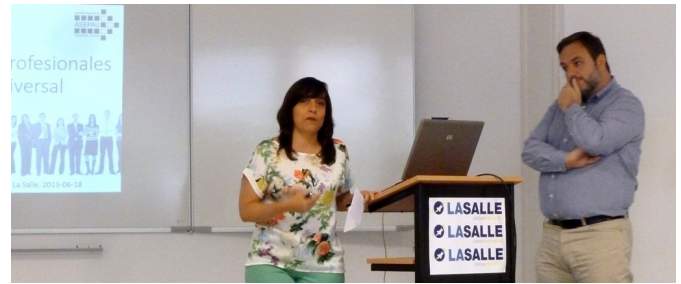
ASEPAU se presenta ante el Comité Consultivo

Tras la firma del convenio, y dentro de la X sesión del Comité Consultivo del Observatorio de la Innovación y el Diseño Universal de La Salle, tuvo lugar una presentación oficial de nuestra asociación ante un auditorio con representantes de las entidades más relevantes vinculadas a la Accesibilidad Universal. Como se dijo durante la sesión: "Todo suma..."