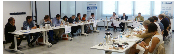
Una vista del Comité Consultivo durante la sesión de trabajo