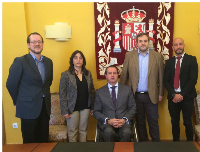
Miembros de ASEPAU junto al Director General de Políticas de Apoyo a la Discapacidad