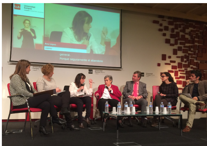
Un momento de la mesa redonda en la UAM

Igualmente, ASEPAU intervino en una jornada con expertos de la Universidad Europea de Madrid para analizar el trabajo de inclusión de estudiantes que se realiza en España, cómo se percibe la diversidad cognitiva y funcional en nuestra sociedad y qué retos debemos abordar. Durante el encuentro, tuvo lugar una mesa redonda en la que participaron junto con ASEPAU representantes de Plena Inclusión, la Confederación de Autismo de España, el Instituto Superior de Promoción Educativa, CEAPAT y Fundación Juan XXIII.