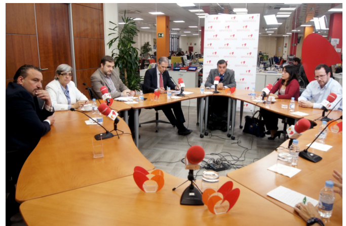
Un momento del desayuno informativo tras la firma del convenio con Fundación ONCE en la sede de Servimedia

Al igual que con CEAPAT, en marzo iniciamos los contactos con la Fundación ONCE con el fin de alcanzar un convenio de colaboración que finalmente fue suscrito a comienzos del mes de mayo. La firma se produjo en el marco de un desayuno informativo en la sede de Servimedia en Madrid y disfrutó de una importante cobertura en medios de comunicación. Como resultado del convenio, los socios de ASEP AU disfrutaron de un descuento en la inscripción al V Congreso Internacional de Turismo para Todos , y el VI Congreso Internacional de Diseño, Redes de Investigación y Tecnología para Todos , celebrados en el mes de septiembre. Además, dos de nuestros socios han resultado becados con la matrícula completa en el II Máster en Accesibilidad para Smart City. La Ciudad Global de la Universidad de Jaén.