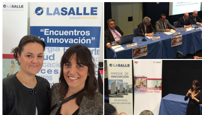
Varios momentos en la entrega de los Premios de Accesibilidad Universal

Noviembre fue el mes señalado para la entrega de III Premios de Accesibilidad Universal que la LaSalle y 3M organizan cada año. Como no podía ser de otro modo, nuestra asociación estuvo allí para felicitar a la premiada y a los organizadores de estos premios que permiten promocionar la creación accesible y el diseño universal, poniendo en valor el trabajo de los premiados y los beneficios de su actividad para todos.