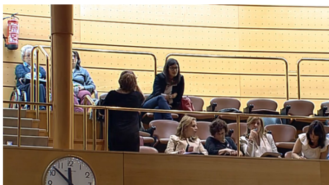
Miembros de ASEPAU visitan el Senado para apoyar la iniciativa '2020 Año de la Accesibilidad Universal'

A finales de abril , ASEPAU estuvo presente en el Senado mostrando su apoyo a la iniciativa para declarar el año 2020 como Año de la Accesibilidad Universal. La moción, que salió adelante por 155 votos a favor, 78 en contra y dos abstenciones, planteaba en su origen que fuera 2017 el Año de la Accesibilidad Universal, pero una enmienda retrasó esta fecha hasta 2020. Desde aquí agradecemos la iniciativa y participación individual de varios de nuestros socios.