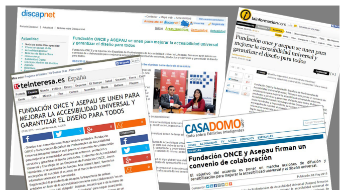
Impacto en medios del convenio Fundación ONCE-ASEP AU