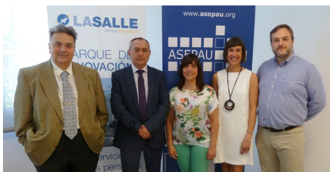
Miembros de ambas entidades posan tras la firma del convenio

Tras la firma del convenio, y dentro de la X sesión del Comité Consultivo del Observatorio de la Innovación y el Diseño Universal de La Salle, tuvo lugar una presentación oficial de nuestra asociación ante un auditorio con representantes de las entidades más relevantes vinculadas a la Accesibilidad Universal. Como se dijo durante la sesión: "Todo suma..."