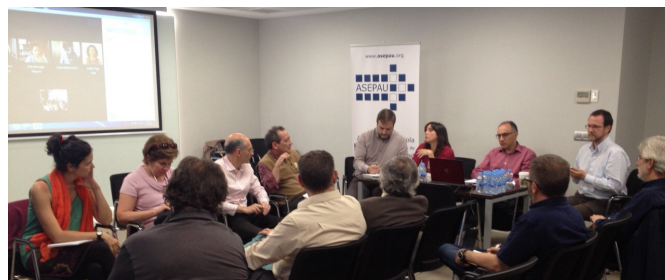
Socios de ASEPAU en un momento del debate

En el mes de mayo dimos comienzo a nuestro ciclo de encuentros profesionales que hemos denominado 'CONVERSACIONES ASEPAU'. Las primeras se dedicaron al tema Malas prácticas en accesibilidad . De nuevo, contamos con una importante participación presencial y online y lo allí expuesto y sus principales conclusiones las recogemos igualmente en un artículo específico de esta revista.