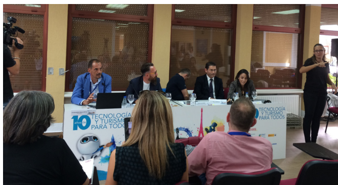
Un momento del panel sobre buenas prácticas en el turismo

Este mismo mes, ASEPAU, representada por nuestra presidenta, estuvo moderando el panel de buenas prácticas de accesibilidad en el transporte dentro de los congresos internacionales de accesibilidad en el turismo y nuevas tecnologías organizados por ENAT y la Fundación ONCE. Fue otro fruto de nuestro convenio con la Fundación.