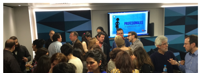
...y el momento de relax para rematar la jornada